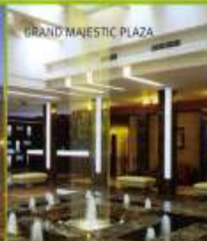
GRAND MAJESTIC PLAZA